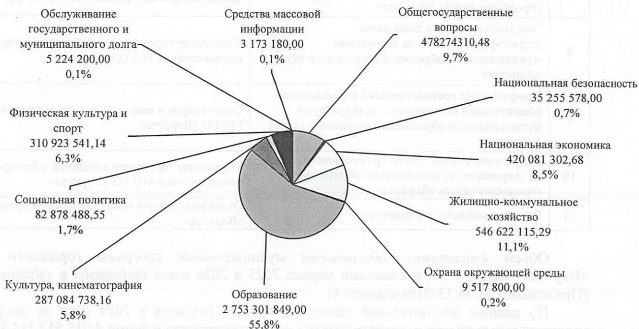
Диаграмма № 2 (руб.)

Общий объем расходов 4 932 337 103,30 руб.